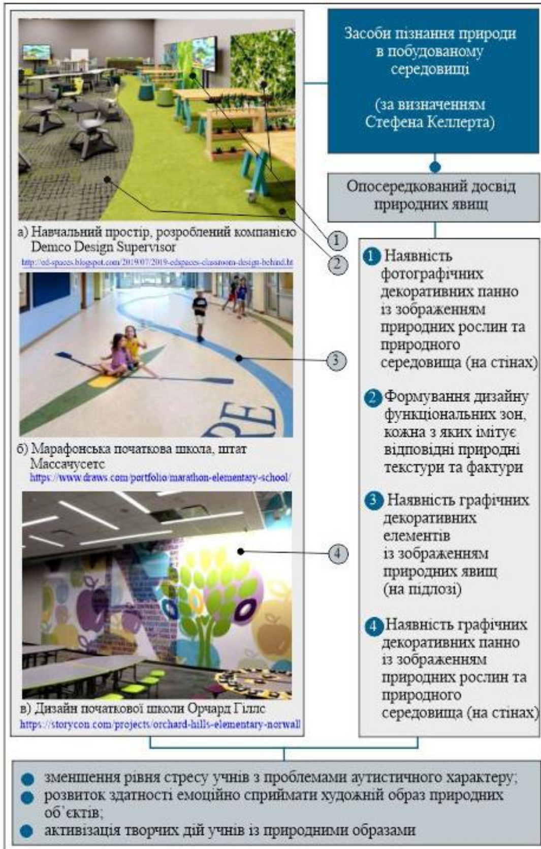
Іл. 2. Опосередкований досвід природних явищ у дизайні інклюзивного середовища навчального простору 2